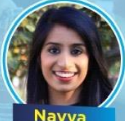
Navya Univ. of Delaware