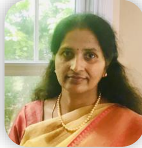
Anu Para Cultural Chair